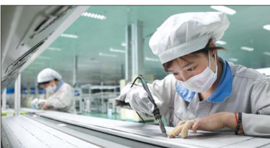
江苏连云港一家能源公司的工人在生产出口欧洲的光伏产品。

本次反倾销调查将延续15个月。欧盟委员会表示,一旦倾销证据确凿,将可能采取贸易保护条款对中国产品征收9个月临时反倾销税。