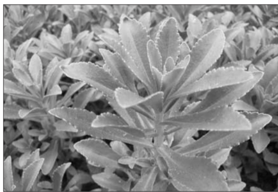
养心茶原材料:养心菜

据有关人士统计,近日在市场上有一种新茶倍受人们喜爱,特别是中老年人和经常在外面吃饭喝酒的人士喝该种茶的居多,它就是养心茶。本人对茶很感兴趣,并对茶研究多年,据我了解,养心茶作为一种高端的养生保健茶。养心茶好就好在它的原料上,其原料为景天三七俗称养心菜,养心菜在《植物学》中称为费菜,中草药学名景天三七,土三七,营养丰富,富含人体需要的蛋白质、脂肪、碳水化合物、胡萝卜素、粗纤维、维生素、谷脂酸、黄酮类景天庚糖等。景天三七是一种名