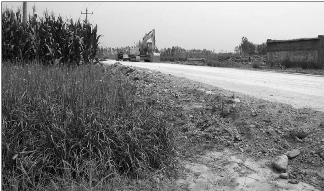
路边老排涝管被掩埋,路面明显高出两侧的庄稼地。

6日下午,韩集乡政府一高姓负责人表示,曹庄村地势低洼,原先叫“曹家洼”,而村北头横穿的公路属于聊牛路至韩集乡的乡间公路,由于分段施工,此路段开工不久。乡政府接到了村民反映,已经组织人力协同村干部,实地走访后,已经做了协调,并联系好施工队,最快当天下午就安排铺设新的排涝管道,了却村民的一块心病。