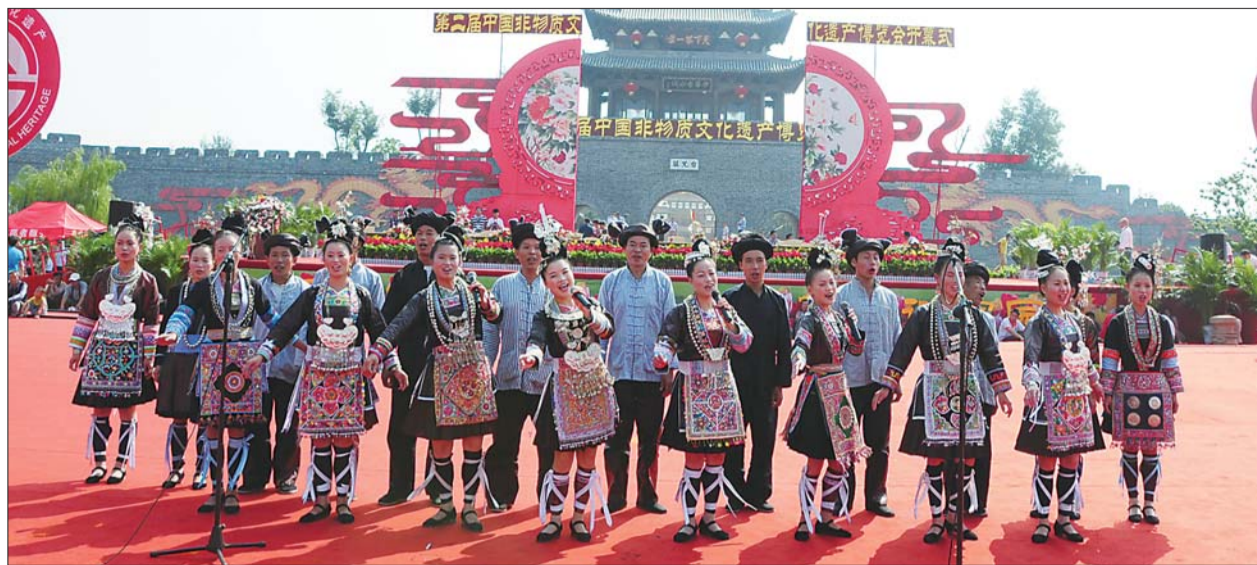
在开幕式上表演的民间艺术。