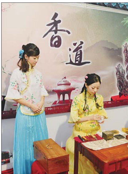
美女成为非博会上的一道风景。