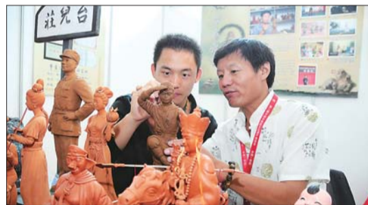
记者体验泥塑的制作过程。