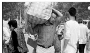
▲ 一位家长正在帮新生扛行李。

▶ 开学第一课拒绝父母帮助的标语,在督促着学生独立完成自己的事情。