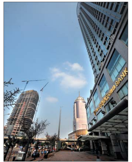
在共青团路和顺河街路口,在交通银行和齐鲁银行对面,300米高的绿地普利中心正在加紧建设。

形成以金融功能突出的标志性CBD,也成为城市的标志性建筑群。这样,金融要素就会自愿向一个方向流动。 归根结底,金融业属于现代服务业范畴,其根基是实体经济,本质也是为实体经济服务。“经济总量上不去,金融业发展将成为无源之水。”张志元说,一个城市的竞争力主要体现在企业、产业和环境这三者的竞争力上,其中,产业竞争力是根本。目前济南金融资源欠缺,区域吸引力不够,竞争力还不强,所以从根本上讲,要向外部拓展空间,内部优化布局,做强产业,不断提升辐射和吸纳能力,使这座城市成为区域内的功能中心,那时就不愁吸引不来金融机构。