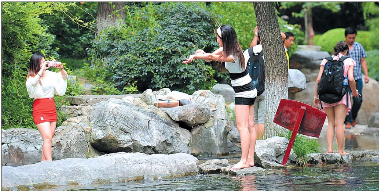
▲济南大明湖景区,免费让市民多了休闲的空间。

我省17市一批公园景区近年来逐渐免费开放,据不完全统计,17市免费开放的重点公园已超过30座,加上区县公益性公园,全省免费开放公园达上百座。免费开放公园不仅使市民的生活得到丰富,幸福感有了提升,而且免费使得客流增加,整个旅游产业链的收益大大提高,超门票收入数十倍。