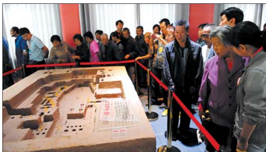
▲9月11日,章丘市洛庄汉王陵遗址公园举行了隆重的落成仪式,宣告遗址公园落成,并免费对公众开放。

“公园景区的免费是大势所趋,如果景区免费后不能养活自己,最终还得靠财政来解决。”对此,业内人士表示,景区免费是好事,从目前来看还有很长的路要走,道路并不平坦。