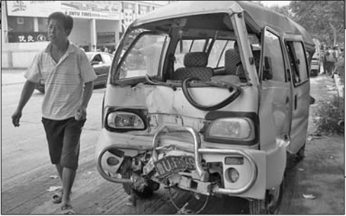
◀面包车被公交车撞得严重变形。