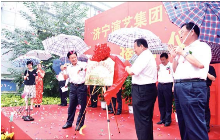
限公司揭牌

据了解,目前济宁市共有国有文艺院团11个,共有职工788人。市直国有文艺院团3个(市杂技团、市豫剧团、市吕剧团),共有职工317人,县市区国有剧团8个,共有职工471人,另外,市直国有剧院3个(声远舞台、济宁剧院、人民剧院),共有职工112人。 曾经,这些国有文艺院团相继打造和推出了《孔尚任》、《运河老店》、《媳妇》、《福星临门》等一大批深受群众喜爱的艺术精品,其中获国际、国家级文化大奖20余个,省级文化奖项100余个。培养造就了一批优秀演艺人