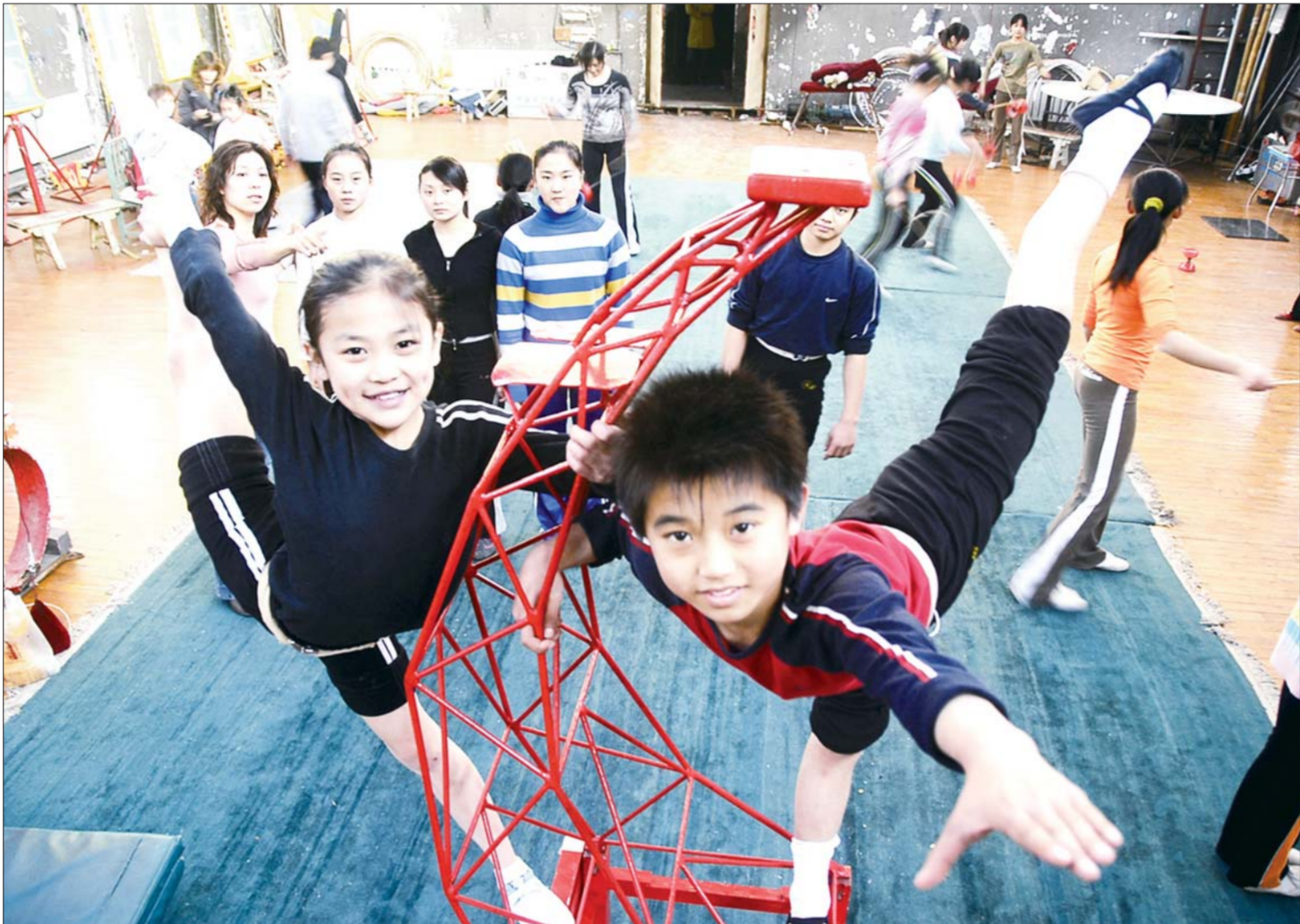
杂技团的小演员们正在刻苦训练(资料片)。

服务第一”为宗旨。沈慧强介绍说,“凡是蟹都汇卖出的大闸蟹煮熟以后如有异味或无膏无黄,一律包赔。蟹都汇每斤有980元、600元、1000元、2000元、6000元五种档次套餐,可在金昌蟹都汇近300家门店通用,其周到的服务,可给消费者保障使每在中秋礼品市场十分抢手。 为了让更多市民能品尝到“蟹都汇”的放心蟹、明白蟹,“蟹都汇”还特地开设咨询热线3289988;位为济宁市民提供关于选蟹、食蟹的金方位资讯。消费者也可直接到科苑路(齐鲁软件园100米)路北“蟹都汇”专卖店订购蟹。