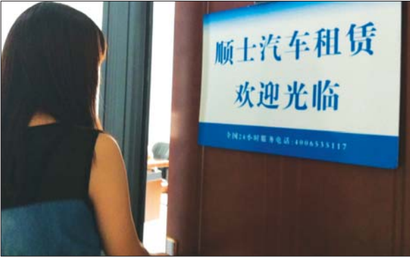
每逢重大节假日,租车市场就比较火爆。

随着自驾游的兴起及国庆节等节假日期间高速公路免费通行,租车行“钱景”更将广阔。然而,记者走访多家租车公司了解到,目前多数公司没有添置新车的打算。 “考虑到成本,没有添置车辆的想法。”烟台通达汽车租赁有限公司赵姓负责人介绍,最近两三年,自驾游租车市场开始火爆。虽然5-10月是租车旺季,其间有不少外地游客在本地租车出游,国庆、春节等大型节日生意也非常火爆,但是,这几个月赚的钱是要来维持整年运营的,压力还是有点大。 该负责人给记者算了一笔账,一辆好车一年的保险费是1万多元,保养费约5000元,加上维修费,一辆好车一年要花将近两万元。“公司有近30辆7座及7座以下商务车和轿车,一年算下来费用不低。”该负责人说,对租车公司来说,节假日高速路免收费肯定是好事,但公司能否增加收益难说。即使高速路免收费,按照往年经验,国庆节、春节等节日,7座及7座以下的轿车和商务车也会比较抢手。 记者了解到,为了保证公司的日常利润,一些租车公司会将大部分车出租给外企驻烟办事处等单位,出租时间基本都在一年以上。