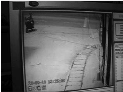
12点25分,男子骑摩托车出现在该居民楼南侧。