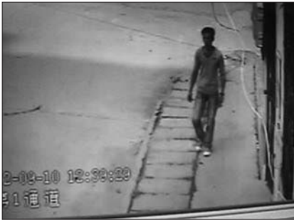
12:39分,该男子出现在居民楼拐角。