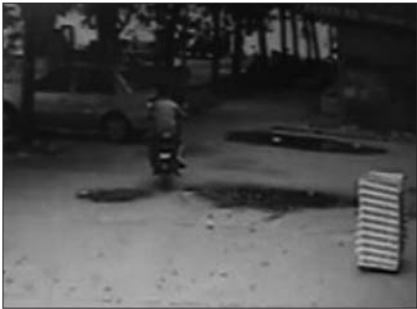
12点35分,白衣男子骑摩托车离开居民楼。