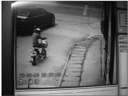
12点57分,该男子头戴一顶淡色太阳帽骑电车出了居民楼。