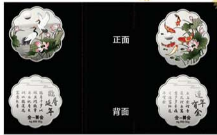
银月饼套装之鱼鹤