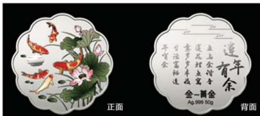
银月饼之连年有余30克、50克