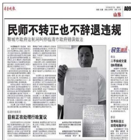
▲本报6月12日报道的版面。 ▶临清市政府办下发的文件。

通过多方联系,“86民师”们向记者提供了这份由临清市人民政府办公室下发的文件(临政办发[2012]31号)——《临清市人民政府办公室关于1986年民办教师待遇有关问题的通知》,通知要求:在岗的1986年民办教师工资待遇提高到在职同等条件公办教师的80%;1986年民办教师的退休年龄执行公办教师国家法定退休年龄,即男年满60周岁,女年满55周岁。新的1986年民办教师待遇标准自2012年9月1日起执行,发布时间为2012年8月28日。