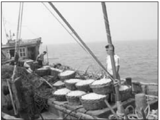
沾化县渔船捕捞的毛虾。

本报9月13日讯(记者 张牟幸子 通讯员 尹宪利) 9月1日12时,沾化县持续三个月的伏季休渔正式结束。在县政府统一领导下,渔业主管部门具体负责,相关部门密切配合,通过完善的工作方法、有力的监管手段,圆满完成了今年伏休管理的各项任务。 禁渔结束,海洋开捕以来,近海渔业资源恢复明显,主要捕捞品种海域资源量明显增长,要捕捞品种为毛虾、海蜇、杂鱼虾等,伏季休渔保护了渔业资源。延长了渔业资源的再生时间,增加了海域生态环境的利用率,主要捕捞品种海域资源量明显增长;提高了渔业生产效益。渔业资源通过伏休期间的繁衍生息,种群数量、质量和品种都有了明显的好转。受伏季休渔规定影响,使部分张网和小网目流网因作业时间短而逐步被淘汰,并开发出以流、钓为主的多种网具作业,拓宽了生产方式。既增加了经济收入,又有利于渔业资源的休养生息。同时,通过在伏季休渔期间举办各种类型的渔业法律、安全生产技能、职务船员培训班,提高了渔民的综合素质水平。 在今年的伏季休渔工作中,沾化县海洋与渔业主管部门部门充分尊重渔民意愿,有效保护了渔业资源,取得了良好的社会效益、经济效益、生态效益。