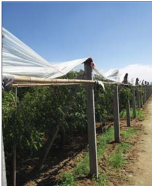
②沾化大棚冬枣外观。