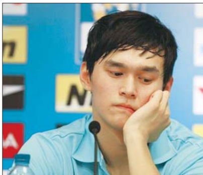
▲孙杨的天津之行收获一篮子的负面新闻。 ►大运会专门为孙杨发红头文件成为笑谈。

法与美国同日而语。 “美国大学生体育协会在厘清职业球员、非职业球员方面,做的工作更加细致,也更加长远。他们甚至会详细记录每位球员每天的训练时间,录入文件库,大学生球员每天的训练不能超过一定的量,首先要保证学业。一旦自己参加了选秀,就属于职业球员,再也不能回到NCAA打球,不管是以什么名义。”一位曾在美国学习NCAA经验的知情人士透露。 他说:“1981年是女排姑娘五连冠的开始,到现在举国体制已经让人很好地证明了自己,现在我们的体育已经领先世界,为什么不换换步子,由精英体育回归到大学体育上去,让更多在校大学生参与到体育运动中来?只有体育、教育真正结合,我们体育强国的名号才会有后劲。”