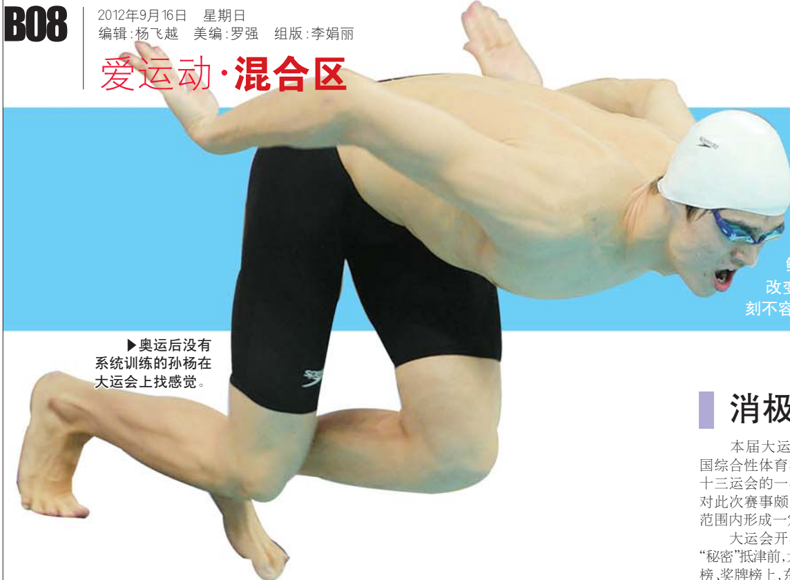
►奥运后没有系统训练的孙杨在大运会上找感觉。