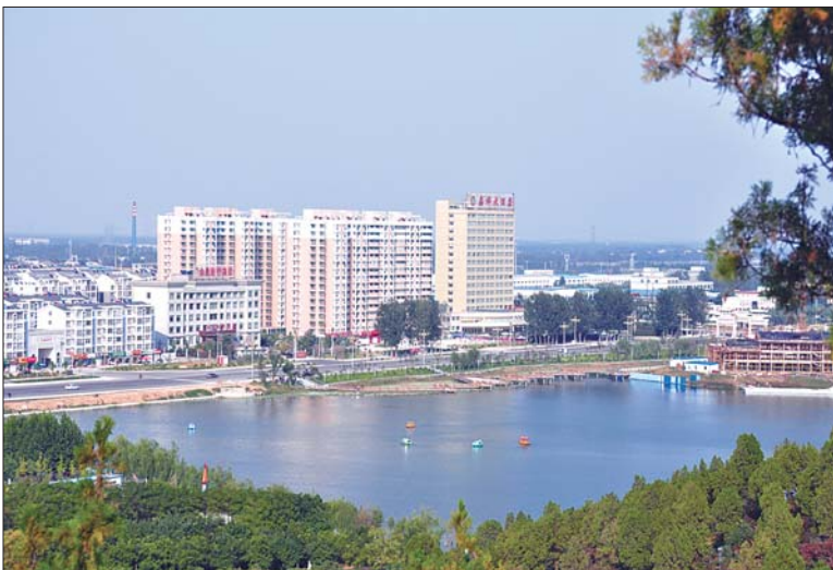
嘉祥县美丽的新城区。

嘉祥县第十三次党代会确立了“建设产业发达、民富县强的实力嘉祥”的目标,实现欠发达向中等发达的跨越。以规划为引领,以大项目为支撑,推进园区、城区、山区、景区、矿区和现代农业示范区统筹发展。