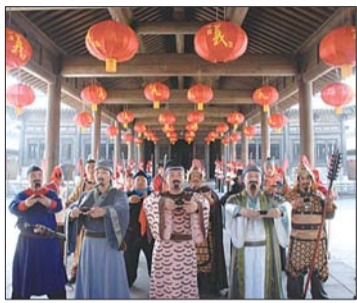
梁山众英雄邀请来宾来山寨一座。