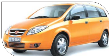
◀1.6L陆风新风尚精致版 七座