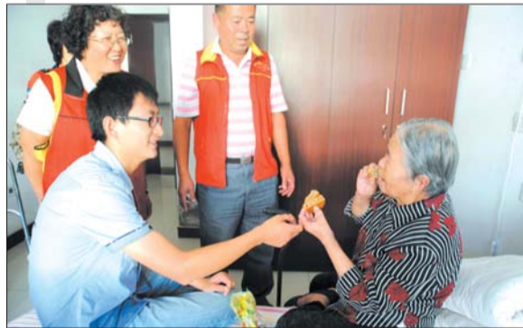
志愿者为老人送来月饼,老人开心地分给大伙吃。

和老人告别时,老人的一句话让记者体会到晚年那种对生命的珍惜。“趁着年轻能动弹,多做自己喜欢的事情,省得到老了后悔。”