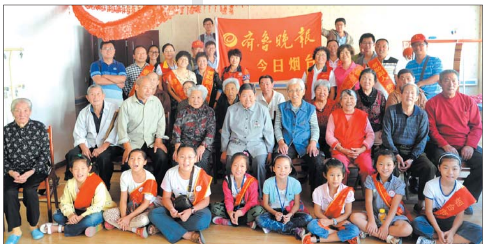
志愿者在福利院与老人们合影。