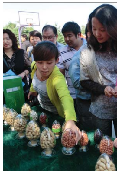
去年柘山花生文化节上,游客参观花生产品展。(资料片)

据了解,柘山镇全镇10万亩耕地有9万亩种花生,柘山花生远销东南亚、欧洲、日本、韩国等20多个国家和地区。2007年,柘山花生通过了国家“有机食品安全许可”认证,2008年被审定“绿色食品”,2009年被农业部授予“中国地理标志产品”,2010年,柘山被潍坊市确定为“标准化种植基地”,2011年被授予“潍坊市农产品金奖”,同年9月在中国第九届农展会上被授予“花生金奖”。去年,该镇举行了第一届花生文化节。