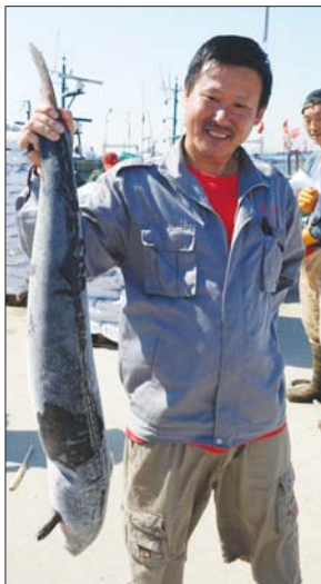
渔民展示捕到的一条30多斤重的大鲑鱼。

本报9月16日讯(记者 潘旭业) 16日,两艘960马力的远洋捕捞船经过15天的作业,安全返回鲁海丰渔业码头,并带回来60余万斤高质量海产品。记者从青岛开发区海洋与渔业局获悉,随着近海资源的枯竭,开发区正在大力发展远洋捕捞,目前已经打造了一只由8艘大马力捕捞船组成的远洋捕捞队,并成功取得了朝韩水域入渔权。