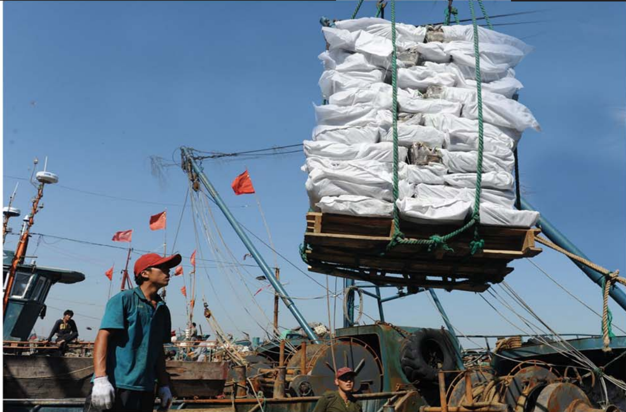
渔民们正在用大型设备从船上卸载捕捞到的海产品。