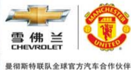
曼彻斯特联队全球官方汽车合作伙伴

企业精神: 卓越 典范 百年信赖 企业目标: 打造最具竞争力、最具影响力的标杆企业 企业宗旨: 客户信赖 社会尊重 员工拥戴 企业发展