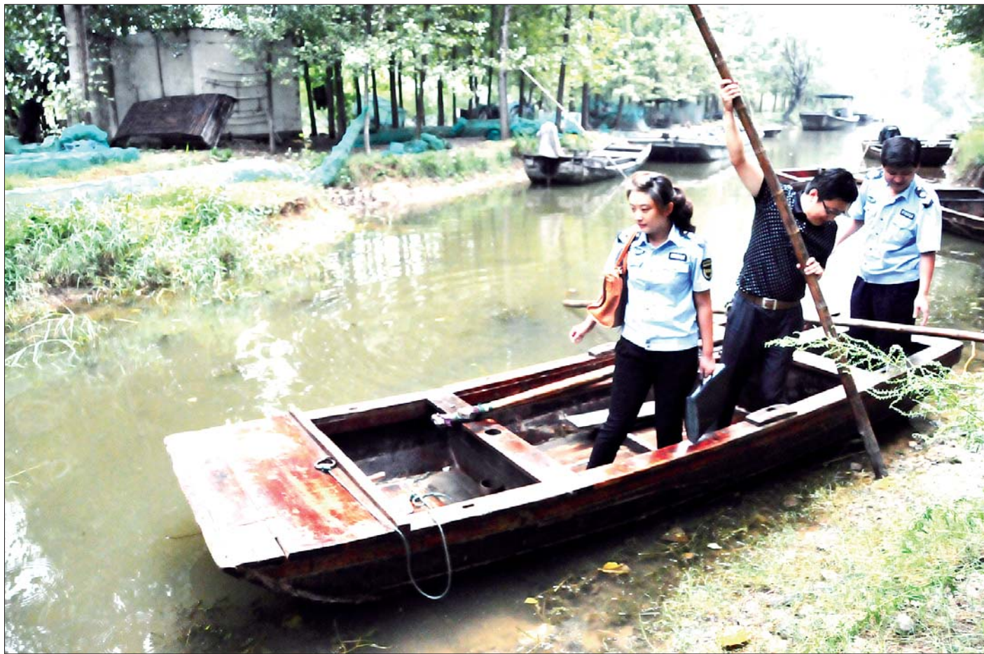
一些小岛只能划小船前往。

波光粼粼的湖面随风荡漾，秋初的荷叶还带着余香，当我们为这美丽的微山湖景色而感到赞叹时，或许对于常年奔波在湖区执法一线的药品监督员眼中，别有一番滋味在心头。