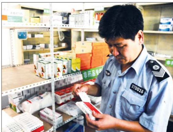
孔维方正检查药品。李岩松 摄