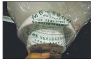
消毒餐具包装上的广告信息。

本报热线967066消息(记者 苑菲菲) 饭店的消毒餐具包装上本该只印消毒厂家的名字，可近日有市民在饭店用餐发现，消毒餐具包装上还印着钢材批发商的信息，这让市民有点摸不着头脑。原来，这是餐具消毒方在包装上印的广告，是用“外快”的方式。