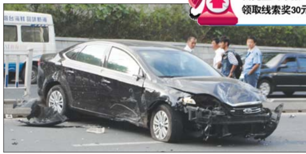
黑色轿车在防护栏上开了近20米后，一个转向冲向了另一侧车道，幸好及时停住。

幸运的是轿车司机王先生并没有受伤，他告诉记者，自己行驶时感觉被右侧的车别了一下，下意识向左打方向盘，接着