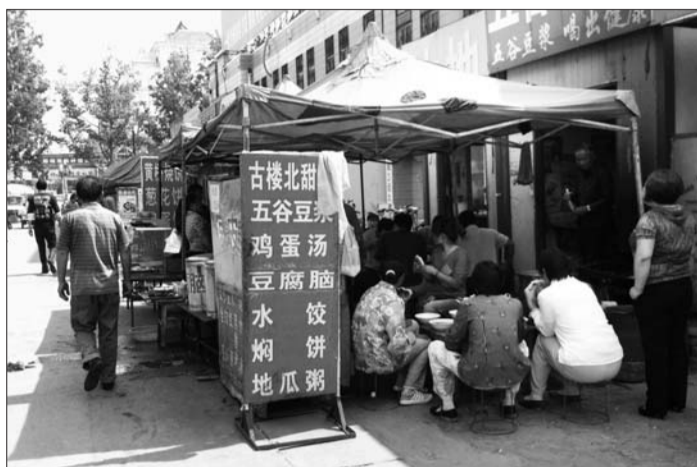
18日,市民挤在铁塔商场附近一家小吃摊吃饭。

早餐没时间做,去外面吃又担心不卫生。针对市民普遍关心的早餐问题,记者最近调查发现,路边摊吃出烂菜叶、头发已不是新鲜事,快餐店员工上岗前很少有进行体检的,如今,想吃个放心早餐确实有点难。