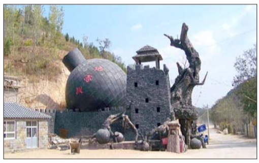
推荐线路四:五台山 平遥古城 乔家大院

地雷战纪念馆位于山东省海阳市区海阳博物馆二楼,招虎山国家森林公园位于海阳市城区东北方向8公里处,利丰推出的这条经典线路既能让您感受红色革命年代的战斗场面,又能享受大自然的美好时光,最适合选择二日游的您。