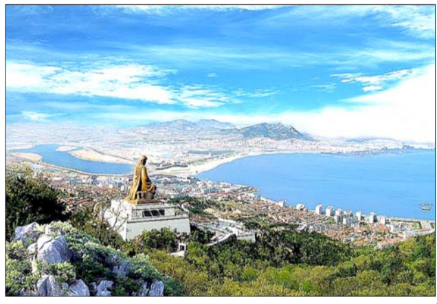
推荐线路三:石岛赤山、大乳山、华夏城

石岛赤山风景区,位于山东半岛最东端的中国首届魅力城市荣成市石岛区,大乳山位于乳山口岸。海边的凉爽海风,红石奇景,加上集休闲、娱乐、居住、商贸等为一体的华夏城,这条经典线路推荐给想要三日游的您。