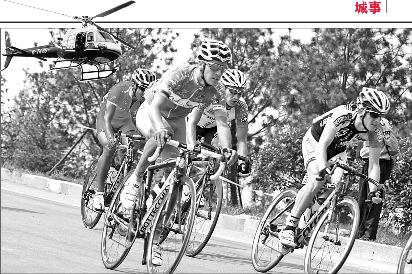
选手们展开激烈角逐。