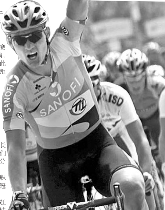
冲过终点,一名选手高举手臂鼓舞自己。

据悉,稍作调整之后,参赛车队已经于20日下午赶往下一站——德州站,将在那里展开全程112km的城市绕圈赛。