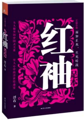
浮石 江苏人民出版社 2012年9月

北京大学教授张颐武说：“裙带经济、国有资产流失等深层次话题被浮石富有艺术魅力地再现了出来。”导演田壮壮则如此评价《红袖》：“关注现实民生的严肃文学不少，但写得情节跌宕起伏、精彩激烈的不多，而《红袖》做到了。”