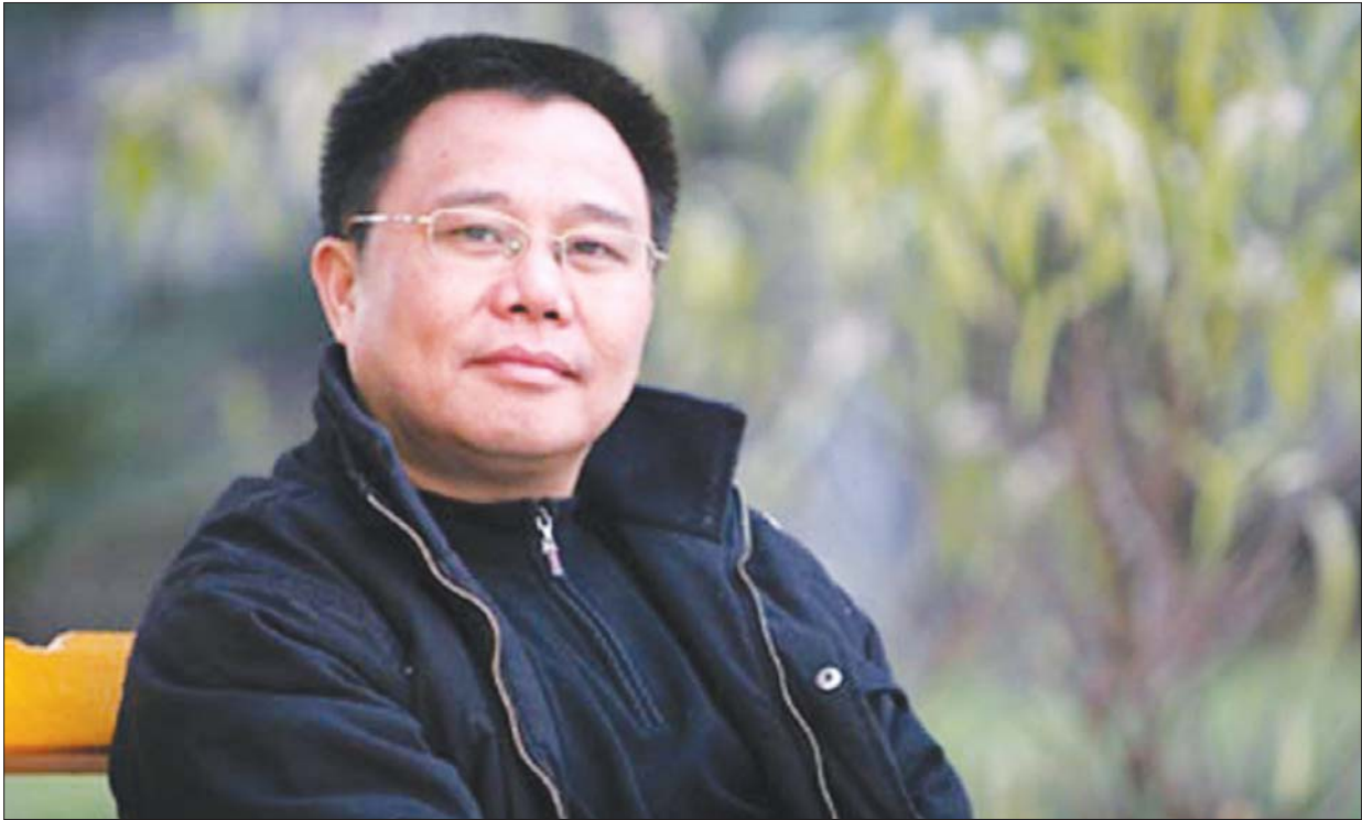
浮石：真名胡刚。长篇处女作《青瓷》获“全国优秀畅销图书奖”，入选“改革开放三十年最有影响力书目”、“经典中国国际出版工程”项目。另有著作《皂香(上)》、《中国式关系》、《非常媒戒》等。