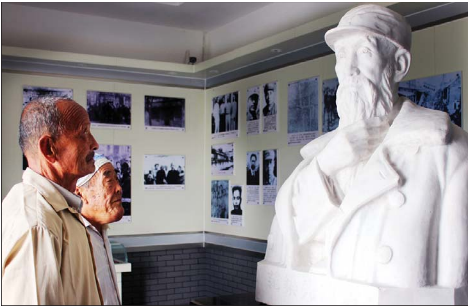
▲纪念馆内设有范筑先将军的塑像。

纪念馆于 1988 年 11 月 15 日、范筑先牺牲 50 周年时正式开馆,如今已成为聊城的经典红色旅游点。