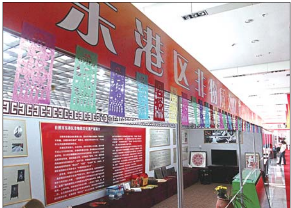
非物质文化遗产和特色民间艺术展区。