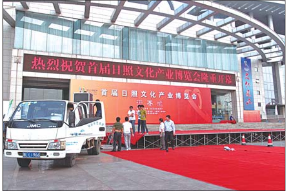
20日下午,会展中心门前舞台搭建就绪。