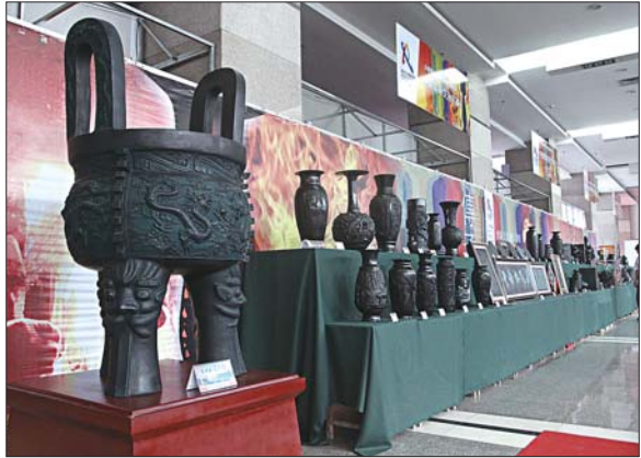
黑陶艺术作品展区陈列的黑陶作品。