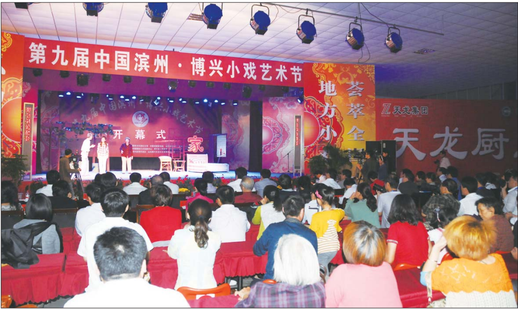
小戏节开幕吸引来不少观众。

本报9月20日讯(记者 李运恒 赵树行) 9月20日,第九届中国滨州·博兴小戏艺术节在博兴县开幕,此次艺术节共有来自全国7个省市自治区的11个剧种36个剧目参演,与往届不同的是,本届小戏节首次增加了小品参加展演。 据主办方负责人介绍,本届小戏艺术节的展演剧种包括山东的吕剧、渔鼓戏、桡腔,江苏的苏剧、通剧、淮海戏、锡剧,河南的曲剧,山西的晋剧,辽宁的小戏艺术节一改以往以小戏为主的演出模式,增加了更贴近百姓的戏剧小品,小品内容主要取材于百姓身边的生活。今年小戏艺术节在以往考虑题材、体裁、地区、剧种等因素基础上,把观赏性作为重要的选择标准。对于那些内容积极健康、基层老百姓喜闻乐见的作品,给予更多的倾斜,鼓励新编的小戏小品的创作以及改编传统作品,扶植濒危剧种和边远少数民族地区的文艺作品,最大限度地满足人民群众对于艺术欣赏的需求。本届小戏艺术节从20日到25日为期五天,共分五场,36个剧目参加演出,