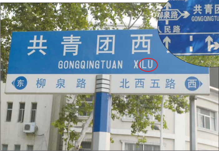
▲两块不同的道路指示牌一个用英文,“ROAD”表示“路”,而另一块用汉语拼音“路”来表示“路”。

及时纠正。 三是规范地名标志,民政部门会按照《地名标志》有关规定,对使用非标准地名、使用不规范汉字、使用英文等外文拼音、设置位置不当等不符合国家标准的地名标志进行清理整顿。 据了解,清理工作9月底前为动员部署阶段;10月份开始调查摸底;11月到12月针对调查摸底查出的问题,以区县、部门为单位进行清理;11月底,对检查出的问题执意不改或拖延不按时纠正的,按照《淄博市地名管理办法》要求进行处罚。