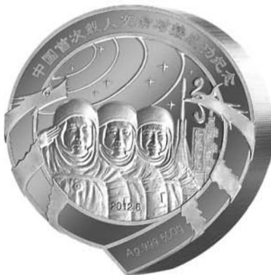
▲9字造型1斤重“天宫纪念银章”正面