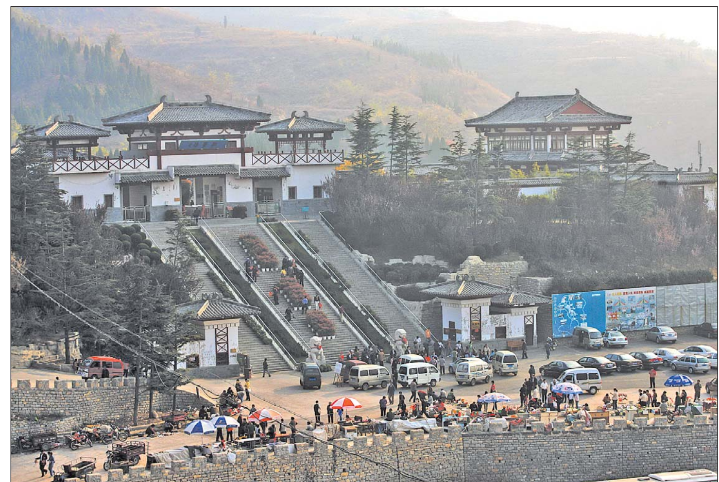
每逢周末和节假日,南部山区各景区都会吸引不少游客。

据了解,目前南部山区景点如九如山、九顶塔、金象山、月亮湾等,门票均已过百。此外,水帘峡景区的门票为90元,跑马岭野生动物世界80元,红叶谷60元,波罗峪60元,均高于市区“三大名胜”的票价。只有四门塔景区的门票价格相对较低,为每人30元。