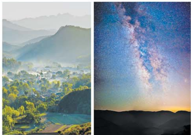
七星台美景