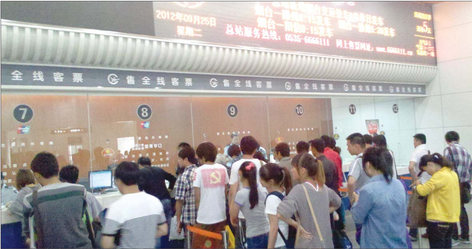
25日上午,烟台汽车总站,旅客正在排队买票。

机场方面提醒旅客,遇到特殊天气,可咨询航空公司或者拨打机场电话0535-6299666、0535-6299999询问。