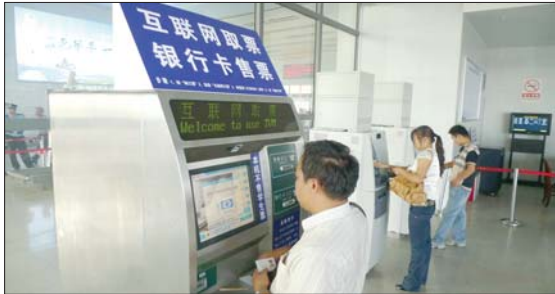
25日下午,火车站内市民用自助售票机购票。

4、超车前,应提高车速,向被超车的左侧靠近,缩短与被超车的距离(车距不大于20米),打开左转向灯并鸣喇叭(夜间用变换远近光灯示意)通知前车,确认前车让超后,向左稍打方向,与被超车保持一定的横向间距,从左侧加速超越;超车前应确认前方道路良好,无驶来车辆。