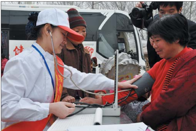
▲“万名母亲”健康查体活动，免费为农村妇女体检。

该院开设了便民门诊，成为便民服务的又一重要举措。便民门诊设于门诊大厅，顾客无需挂号，凭单据，可直接购药、开具超声检查和检验单，缓解了门诊排队、挂号压力，缩短了患者的等待时间，受到广泛欢迎；在儿童保健中心新设门诊叫号机系统，家长在取号成功拿到票后，只需在候诊区候诊，静待电脑自动发出就诊顺序的叫号声，通过语音呼叫、LED 屏显示等形式，引导儿童家长按照整个服务流程完成检查。