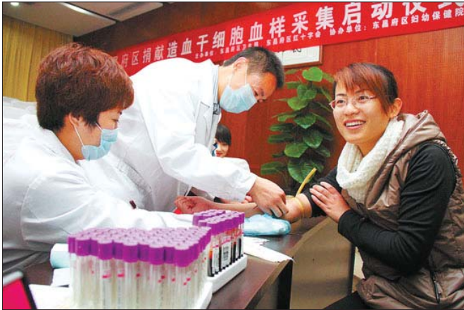
▲积极参与造血干细胞捐献活动，事迹以新华社通稿被全国多家媒体报道。