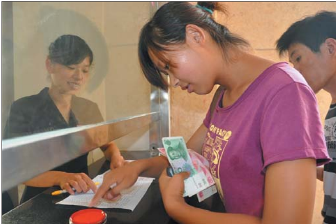
►住院分娩补助发放现场。

医院自申报五星级接种门诊以来，积极按照《星级规范化预防接种门诊评审标准》，稳步推进自身星级规范化预防接种门诊的建设工作。门诊叫号系统的应用打破了传统的候诊模式，儿童娱乐区、喂奶区的建设，深化了服务内涵，保证了患者的就诊秩序，提升了医疗服务环境。