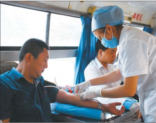
矿区职工在献血。

本报枣庄9月25日讯 (记者 赵艳虹) 25日,枣庄市中心血站的献血车开进了田陈煤矿,两百多名矿工踊跃报名献血,并成功献血92100毫升。