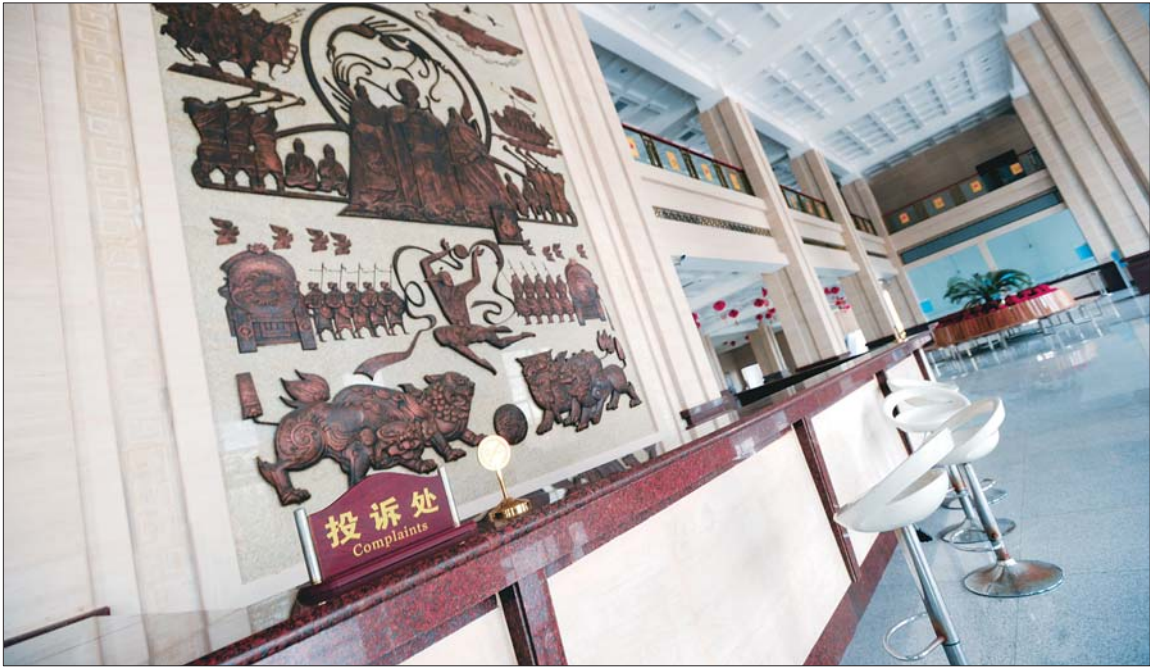
▲9月23日,东平游客服务中心内投诉台里没有任何工作人员。本报记者 左庆 摄

省旅游局还同时拟定了全省47家重点监控的旅游景区,要求各市予以实时监控,及时掌握景区拥堵情况,一旦出现拥堵现象,立刻上报省旅游局总值班室。省旅游局将通过多种渠道,及时反馈发布。通过交通厅,可随时通报给相关路段,做好迎接游客及车辆高峰的准备,及时增加人手、处置突发事件;还要求各市对容量有限、易发生安全事故的景区进行重点监控,制定有力措施,坚决杜绝景区超容量接待游客的现象。