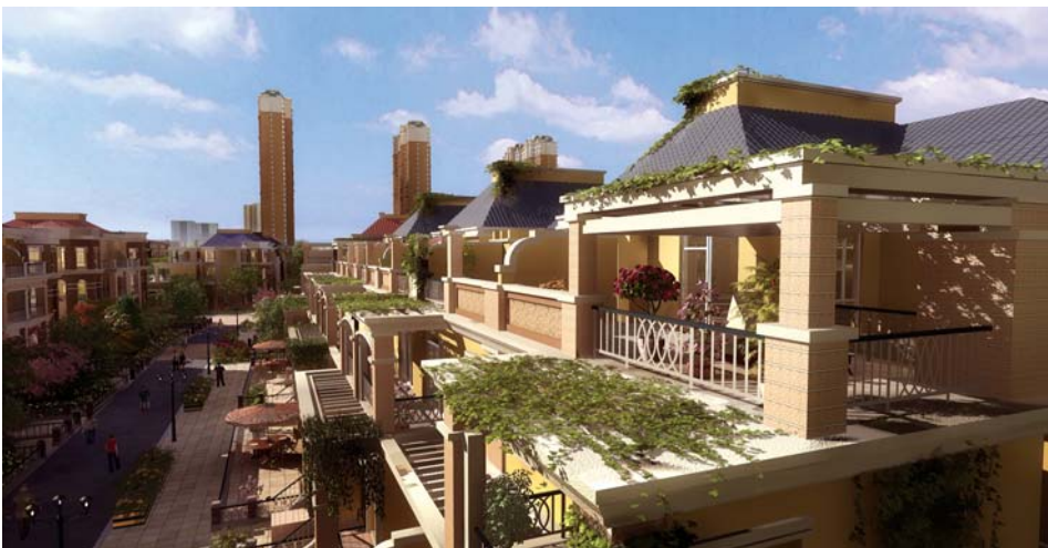
户型成为改善型产品首要考量因素

套房源,全部为94平米、96平米两室,而成交价也仅3700元/平米;中国诺贝尔城开盘房源面积同为90平米、92平米两室,成交价5100元/平米,全部为刚需户型产品。