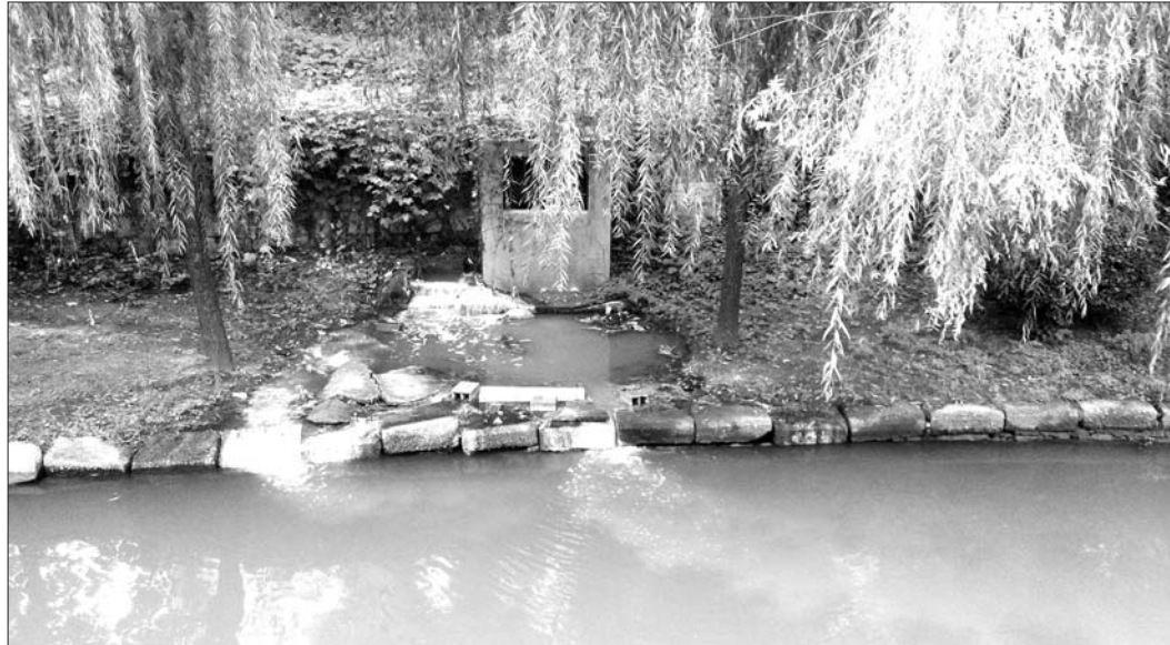
小洗河南岸有污水流向河里。

本报济宁9月26日讯(见习记者王洪磊 通讯员 朱珊珊) 26日,市民陈先生拨打市长公开电话反映,济宁城区的小洗河(古槐路和洗河路交汇处往西200米)有一个排污口,最近几天有污水排入河内。小洗河附近的居民反映气味有点难闻,希望济宁市环保部门及时处理。 26日上午9点半,记者来到陈先生所说的位置。在现场,记者看到小洗河南岸有一个被水泥封堵住的排污口,在排污口的东侧,有散发着异味的污水从地下哗哗地往外流淌,把洗河的水染成了灰白色。“这条河最终流向