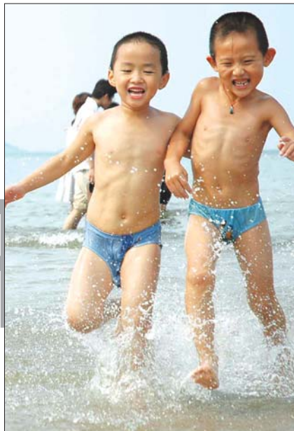
烟台美丽的滨海风光吸引了众多游客。亲近大海,无限畅快。

每一次荣誉的获得对烟台来说,都只是起点。在接下来的创城工作中,凭借“创新,拼搏,协作,包容”的烟台精神,我们有理由相信创城路上,烟台势在必得。