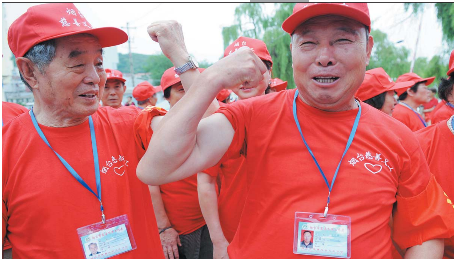
创建文明城市,志愿者和慈善义工一直在行动。图为2010年,退休老人加入到慈善义工的行列中,承担起社区日常巡逻任务。