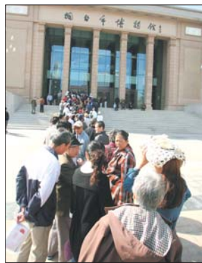
2011年9月20日,烟台新博物馆开馆试运行首日,馆外排起了长队。

除此之外,近年来烟台市全民健身工程发展迅速,全民健身工程器材普及到80%的小区。