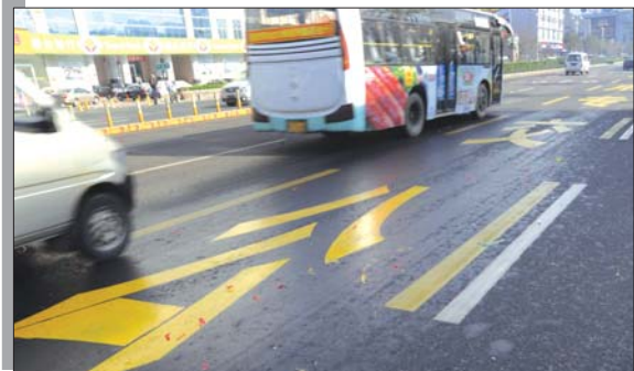
2011年11月21日,北马路公交专用道启用。

据交通局工作人员介绍,未来将逐步建立起以快线为骨干,副线为基础,直线为补充的三级公交网络,实现公交与其他运输方式的无缝对接。结合城市发展,道路拓宽改造和新校区建设,进一步优化调整公交线网布局,重点做好福山区、牟平区内公交线网的优化调整,方便市民出行。