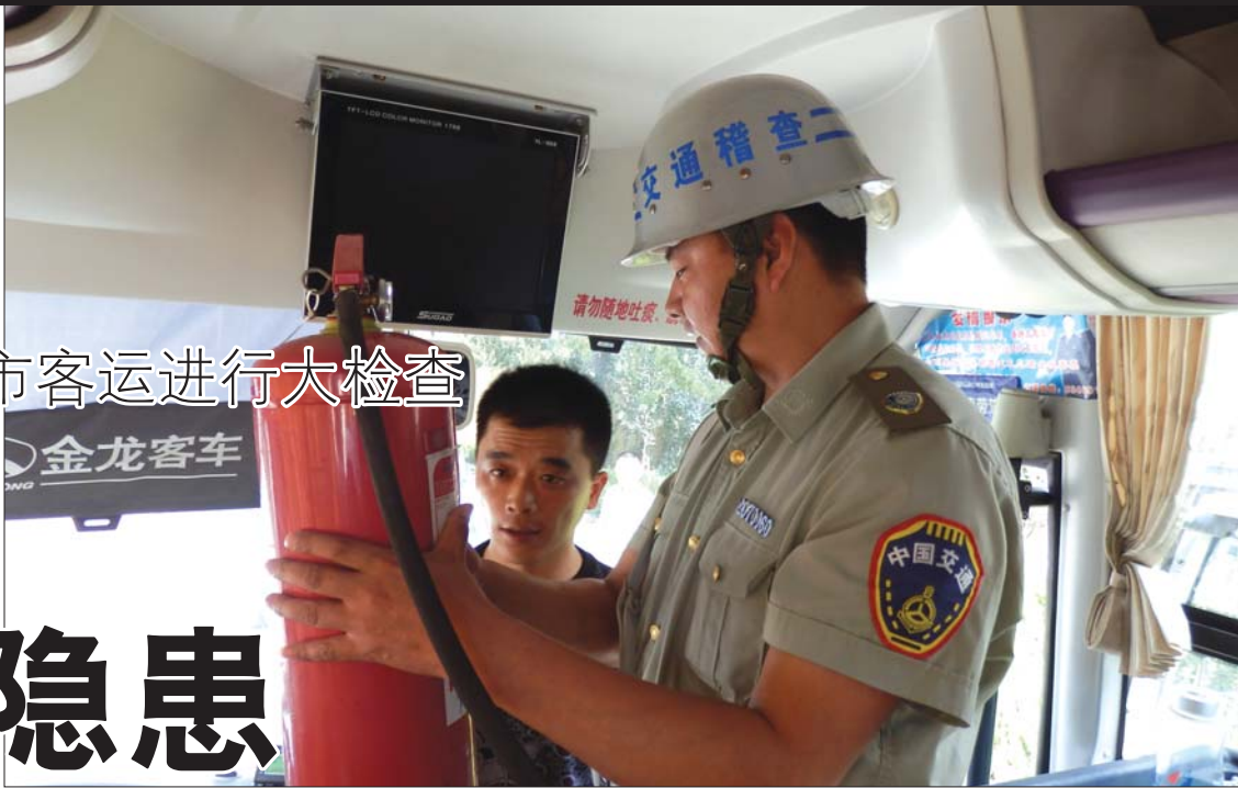
检查人员在对客车上的消防设备做检查。