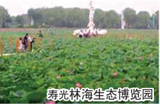
寿光林海生态博览园