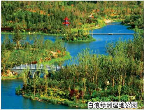
白浪绿洲湿地公园