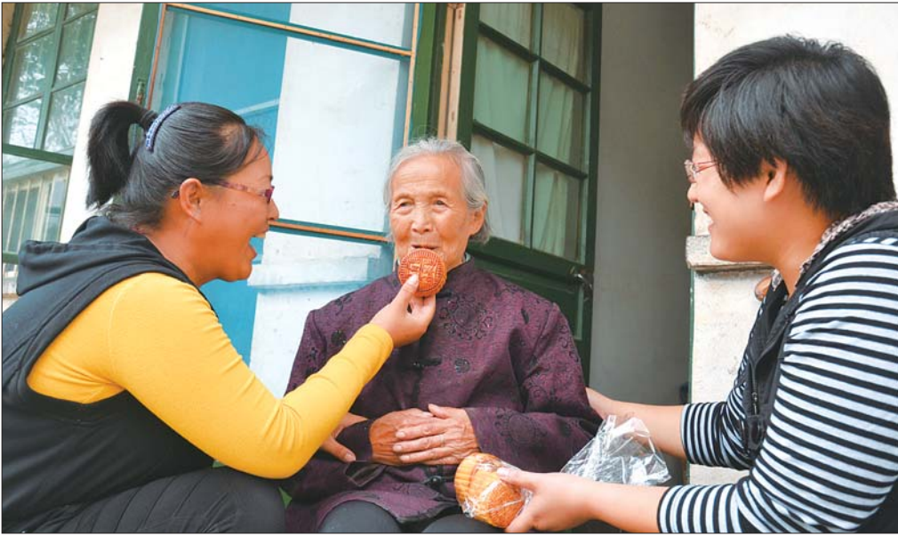
9月26日,黄河口镇志愿者在给黄河口镇敬老院老人送月饼。近日,黄河口镇妇联组织巾帼志愿者在全镇开展了“迎中秋·送温暖”活动,服务对象包括镇上的空巢老人、孤寡老人、残疾人和留守儿童。

之际,进入宿舍盗窃李某笔记本电脑1台、手机1部。经鉴定,被盗物品价值合计人民币4805元。案发后,被盗笔记本电脑和手机均已被追回返还给李某。 法院经审理认为,被告人王某以非法占有为目的,窃取他人财物价值数额较大,其行为已构成盗窃罪。被告人王某如实供述自己的罪行,可以从轻处罚。被告人王某积极退赃并取得受害人的谅解,对此可酌情予以从轻处罚。据此,法院依法作出上述判决。