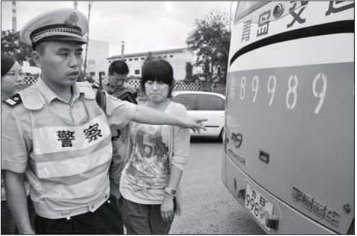
民警检查一辆大客车发现该车刹车灯不亮。

据了解,双节来临,青岛长途客运将迎来高峰期,四方交警大队开展了双节期间道路整治行动,并在长途站、四流南路长沙路、人民路鞍山路、黑龙江路长沙路、重庆南路萍乡路设置五处查车点,夜间在重庆南路、黑龙江南路等主干道确保一辆警车上路巡逻执勤,严厉查处长途客运车辆超速、超员、疲劳驾驶、污损号牌、长时间占用最左侧车道和违法停车等重点违法行为,确保行车安全。