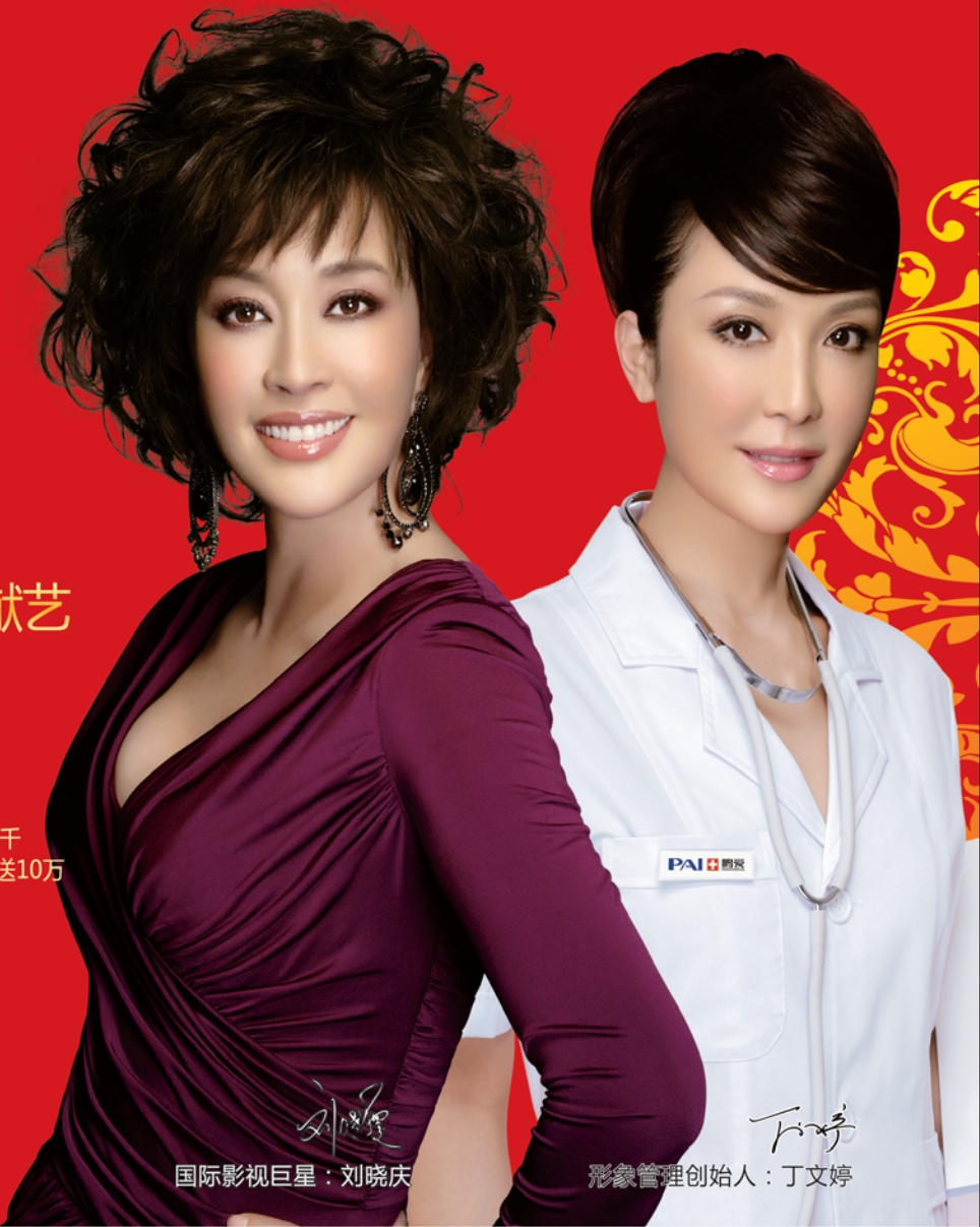
国际影视巨星: 刘晓庆

28日下午2:00举办《瑞典瑞兰玻尿酸—微整形交流会》,瑞典瑞兰厂家现场赠送玻尿酸,买1送1,仅限20支