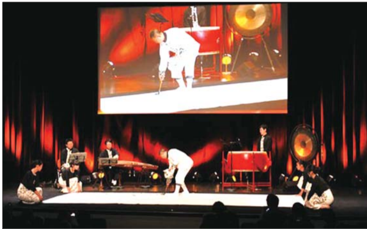
中国书法家曾来德《墨乐巴黎》创作现场。

曾来德，1956年生，四川省蓬溪县人。现为中国国家画院书法篆刻院执行院长、艺委会委员、教学部主任，国家一级美术师，中国书法家协会理事、教育委员会副主任，北京大学客座教授，世界华商书画院院长。上世纪80年代初拜著名书法家胡公石先生为师，研究今人的审美，融进时代精神并创造自己的书法风格。他不但是一位书法大家，也是一位独辟蹊径的山水画大家，在国内外产生广泛影响。近年来先后在中国美术馆、上海、江苏、武汉、西安、成都、合肥、沈阳、郑州、深圳、山东等地美术馆博物馆举办“曾来德书画艺术展览”，引起社会各界的广泛关注，被书坛誉为“曾来德书法文化现象”、“书坛奇才”、“曾来德书法文本”等。2005年在英国大英博物馆举办“曾来德书法艺术展览”和“墨乐”东西方文化高峰对话系列活动，以及随后的“墨乐”北欧四国之行在国际上引起了强烈反响，书法作品《鸱鹭》，山水画作品《天地之象》被大英博物馆收藏。2011年11月，曾来德先生的“墨乐巴黎”系列文化活动在法国国家议会宫、法国中国文化交流中心等地方举办，又有了新的突破，充分彰显了中国古老文化的艺术魅力以及现代价值和生命活力。