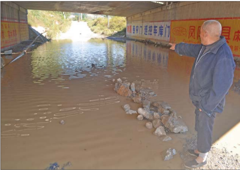
▲27日晚一场雨过后,付家庄高速路桥下一片汪洋,几千名村民出行受影响。

据村民介绍,这座高速路桥建得太低,一些大车根本没有办法通过。村民没办法,就把桥下的道路挖了一些,但是每次下雨都会积很深的水。